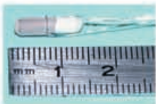
MicroPoas® à taille réelle MicroPoas® real size

Utiliser la MicroPoas®, c'est optimiser la sécurité de vos installations et de vos procédés. Sonde zircon à référence interne métallique : indépendante de l'environnement extérieur. Pas de gaz de référence nécessaire pour une simplicité de mise en œuvre.